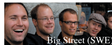
Big Street (SWE)

20.30 Kebab och franska i församlingshemmet 21.30 Konsert med Orion & Big Street Lovsång och bön över tolvslaget Fyrverkerier med KBG Lovsång med Big Street Caféet öppet LÖRDAG 9.30-10.30 Frukost 11.00 ”Tack och hej!” Städtalko Hemfärd ca 13.00